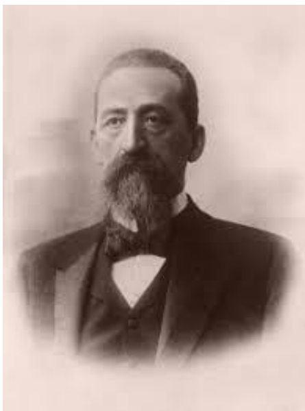
Eduardo Porro 1842-1902.

In de 2 e helft van de 19 e eeuw was de maternale mortaliteit van een laparotomie bijna 100 % en deze operatie gaf een mortaliteit van 30-58%. Omdat de operatie ook betekende dat er geen verder nakomelingen konden komen en nogal mutilerend was, werd verder gezocht naar verbeteringen van de chirurgische techniek van de sectio caesarea. In 1881 was er opnieuw een belangrijke ontwikkeling toen Adolf Kehrer de transversale incisie in het onderste uterus segment introduceerde en deze ook hechtte na het verwijderen van kind en placenta. Daarvoor werd de uterus wel eens in het onderste uterus segment geopend, maar nooit gehecht. Deze techniek, samen met de toen ingevoerde asepsis, deed de mortaliteit in het begin van de 20 e eeuw dalen tot 5-10%.