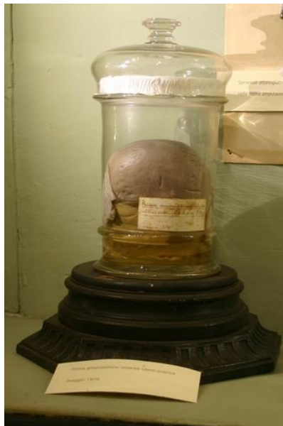
Origineel uteruspreparaat dat Edoardo Porro verwijderde bij zijn eerste, naar hem genoemde, operatie.