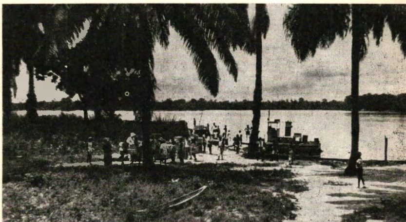
De aanlegplaats van het ziekenhuis.