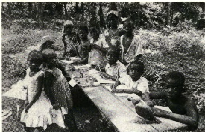
Kinderen in het lepradorp