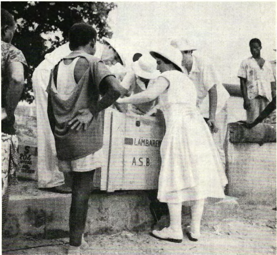
„Wij zijn de Nederlanders dankbaar voor wat zij voor de zwarte broeders deden...”

Wij hebben thans begrepen, dat de Nederlandse dames veel sympathie voor de persoon en het werk van dr. Schweitzer hebben en hierdoor gaarne medewerken aan het werk van barmhartigheid in Afrika.