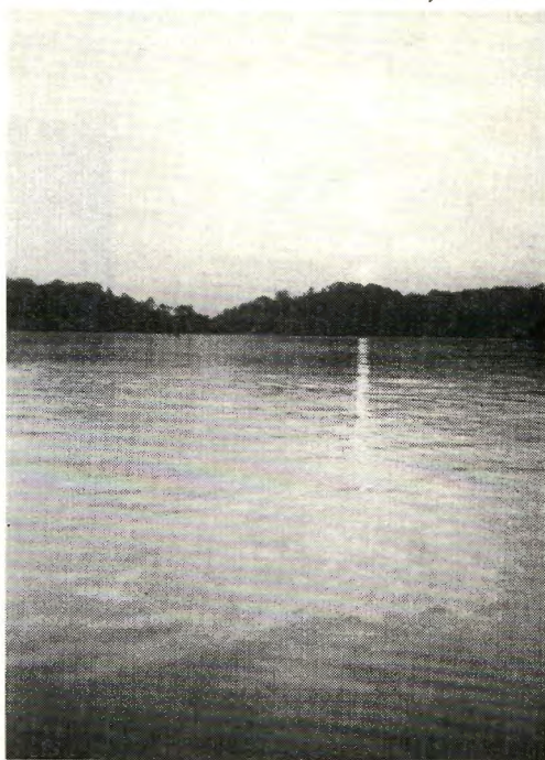
Avond op de Ogowé

De stukken, waarin Schweitzer als jongen optreedt worden vertolkt door een neefje van Albert Schweitzer.