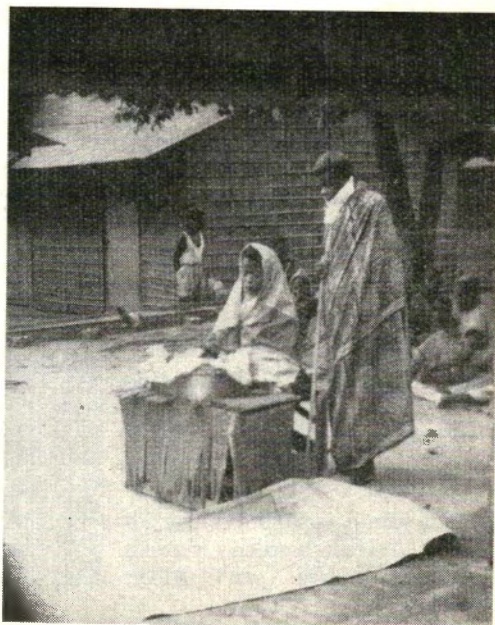
Kerstfeest in Lambarene