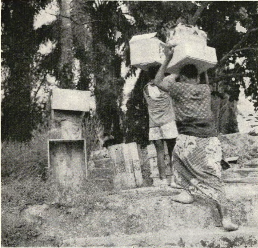
De zendingen uit Nederland worden in Lambarene gelost

Mogen we onze vrienden nog even wijzen op ons nieuwe gironummer n.l. 91 60 71.