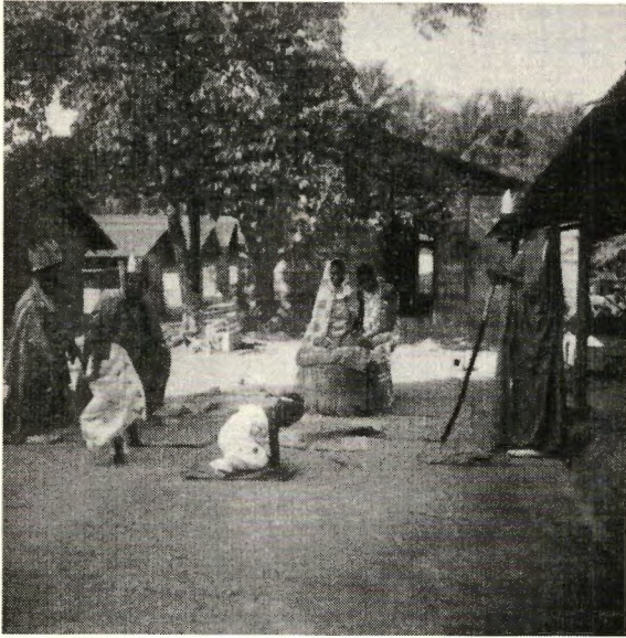
Koningen uit zo'n verren land.....

hulde bewijzen en brengen een gouden rol en een staaf ivoor. De klanken van het slotkoor gaan naar dr. Schweitzer, die temidden van zijn zieken staat, naar zijn