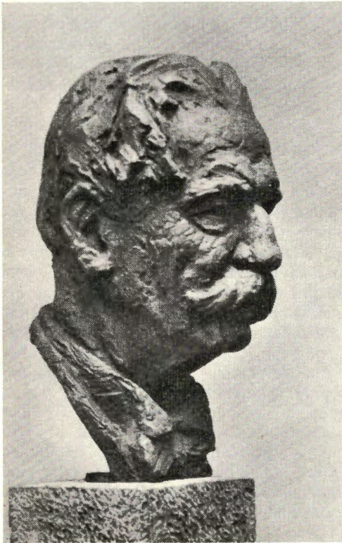
De buste, vervaardigd door Pieter de Monchy.

Ongetwijfeld is het een prachtig idee, te weten dat Schweitzer, die op zijn totaal eigen wijze voor de vrede werkt en waakt, een plaats heeft in het Vredespaleis.