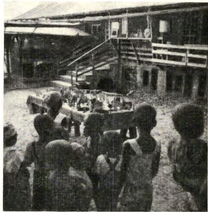
Speelgoed uit Duitsland voor de kinderen met Kerstmis

's Middags tegen vier uur wordt er boven op het pleintje voor de kamer van dr.