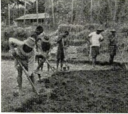
Tuinieren in Lambarene

als ziekenverzorger nodig zijn. De zuster, die het opzicht over deze mensen heeft, houdt appèl en deelt de nodige gereedschappen uit, zoals hakmessen, bijlen en schoppen. Dr. Schweitzer regelt het werk. Een groepje is voor de tuin bestemd. Onkruid moet verwijderd, water gehaald, aarde aangebracht worden, enz.