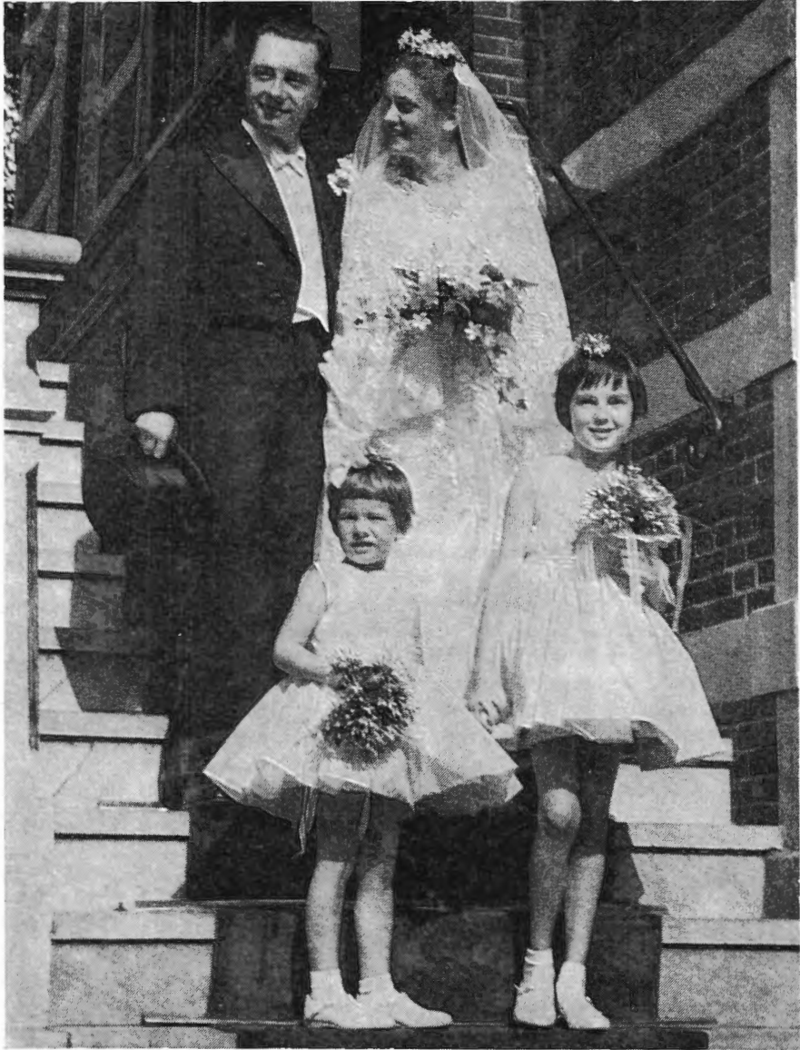
Het bruidspaar op de stoep van het gemeentehuis te Bussum

In de geest van Albert Schweitzer gaan zij in het Zuiden van Frankrijk een centrum vestigen op het platteland voor ontheemden en vluchtelingen, voor verlaten en verwaarloosde kinderen. Zij willen trachten om iedere familie een eigen woning, een eigen thuis te geven, waar het persoonlijke leven tot zijn recht kan komen. Het werk zal op coöperatieve basis verricht worden. Het zal bestaan uit: landbouw, groenteteelt, fruitteelt, veeteelt, bebossing, viskwekerij, nuttige en artistieke handenarbeid.