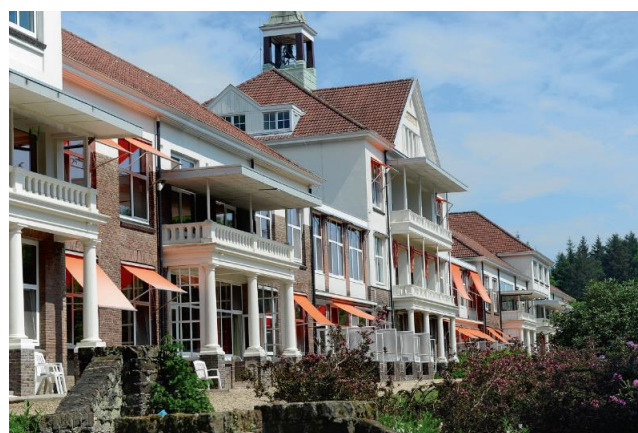
Voormalig sanatorium Dekkerswald in Groesbeek, gevestigd in een bosrijke omgeving vanwege de buitenlucht, voorheen voor revalidatie van TBC-patiënten nu nog steeds in gebruik voor longrevalidatie.