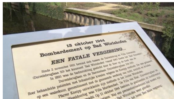
Herdenkingsplaquette op de locatie van het voormalige kuuroord Bad Wörishofen in Breda.