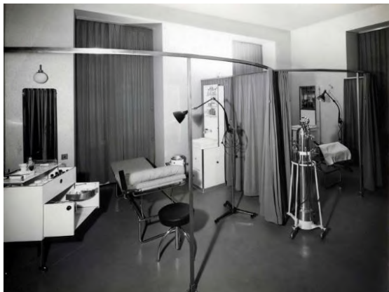
Behandelkamer fysiotherapie in Zürich 1945.

In het huidige Nederland wordt echter bij een kuuroord in eerste instantie gedacht aan een mooie locatie in Zuid- of Oost Europa. Alle plaatsen waar 'Bad' voor staat zijn gerenommeerde 'Kur Orts' (Bad Alexanderbad, Bad Brückenau etc.).