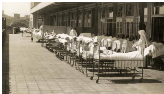
Heliomare te Wijk aan Zee, kuren in de buitenlucht aan zee in 1938, inmiddels getransformeerd in een revalidatie centrum.

Zo kenden we het Kurhaus in Scheveningen maar ook andere instellingen die zich speciaal in het begin van de vorige eeuw aan de zee vestigden aan zee zoals Zee hospitium in Katwijk en het voormalige sanatorium voor Tbc-patiënten in Heliomare (Latijn voor zon en zee) waar patiënten 24 uur per dag in de buitenlucht verbleven met de hoop op genezing.