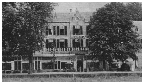
Kuuroord Bad Wörishofen 1939. Voor uitgebreidere documentatie zie info onder de referenties.

Om gerichter te speuren stelden we ons de volgende vragen: Wat werd er verstaan onder een kuuroord en om hoeveel of welke kuuroorden ging het in Nederland? En hoe zat het met het domein van de heilgymnast/masseur?