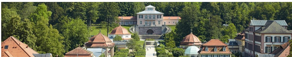
Huidige kuuroord in Bad Brückenau in Beieren waar vele krankengymnasten werkzaam zijn.

"Vereniging voor de verzorging voor gebrekkigen" . Daar wilde men in Nederland wel sanatoria en kuuroorden voor bouwen. Echter "den gezonden mensch" gezond te houden? Dat werd als luxe gezien en moesten we hiervoor toch echt naar het buitenland waar kuren van ouds her voor iedereen vergoed wordt, al heet het tegenwoordig vaak ook 'wellness'. Veel krankengymnasten en fysiotherapeuten (veelal uit Nederland) werken momenteel dagelijks in kuuroorden in Duitsland, Zwitserland en Oostenrijk.