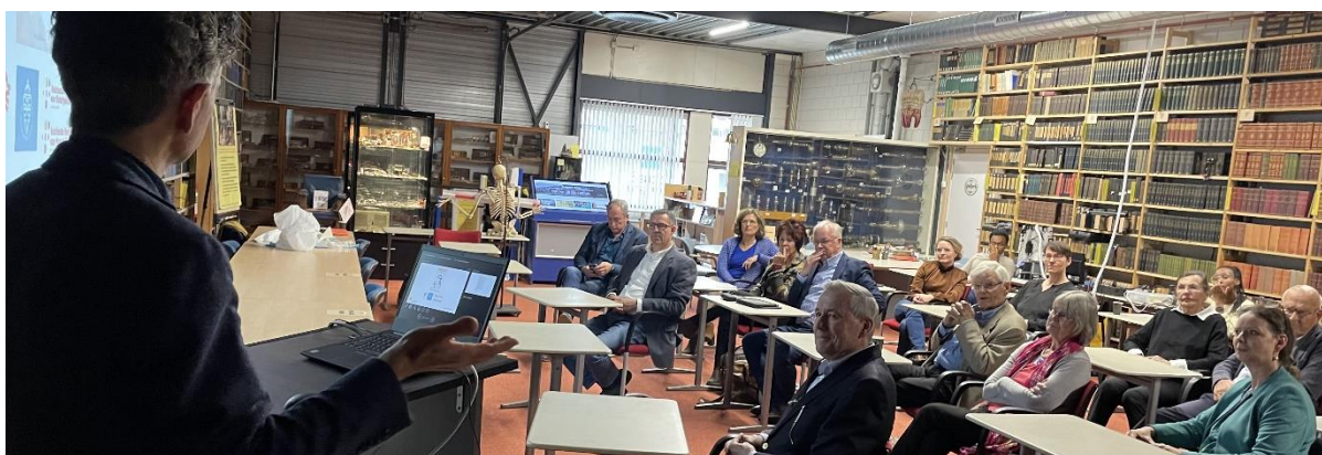
Congresruimte van het Trefpunt Medische Geschiedenis Nederland.

Interessant wordt de blik vooruit, hoe ons vak er over 10 jaar uit ziet? Dit kan ook voor de startende fysiotherapeuten een eyeopener zijn en mogelijk zelfs richting gevend zijn voor de keuzes die zij gaan maken.