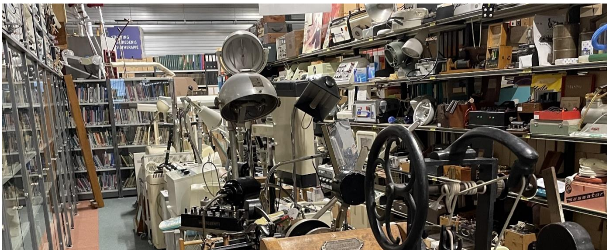
Boekencollectie en medische instrumenten in het Trefpunt Medische Geschiedenis te Urk

waardoor de belangstelling voor ons historisch erfgoed, ook buiten de fysiotherapie, is toegenomen. Naast het Trefpunt werkt de SGF samen met de Nederlandse Vereniging voor Medische Geschiedenis (NVMG), een multidisciplinaire vereniging met leden die een passie hebben voor de medische geschiedenis in de meest brede zin van het woord. Vanzelfsprekend worden ook de internationale ontwikkelingen van de geschiedenis fysiotherapie op de history.physio website gevolgd.