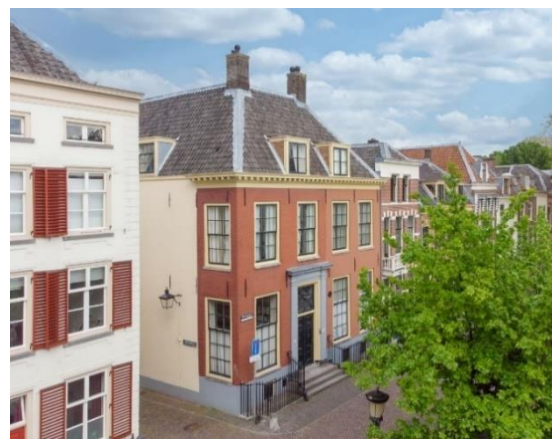
Het Medico-Mechanisch- Zanderinstituut (L) aan de Nieuwegracht 64 te Utrecht (1905-1931), oud en nieuw.