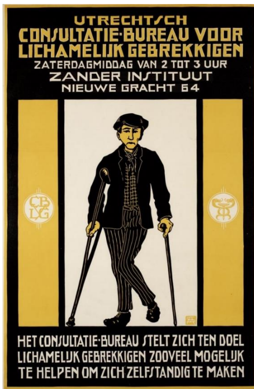
Reclamebord afkomstig van het Zanderinstituut aan de Nieuwegracht te Utrecht en vervaardigd bij de Utrechtse drukkerij 'Van Boekhoven'.