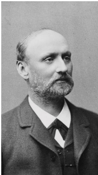
Dr. Gustav Zander, oprichter Zanderinstituten

Zanderinstituut werd opgericht, staat er nog steeds en is nog steeds bewoond door een fysiotherapeut. Deze Zanderinstituten stonden bekend als "Geneeskundige inrichting voor Zweedse Gymnastiek en Massage" genoemd naar Dr. Gustav Zander die medische oefenapparaten ontwikkelde die gebruikt werden door heilgymnasten. In FysioPraxis heeft de SFG hier eerder een artikel aan gewijd. 3