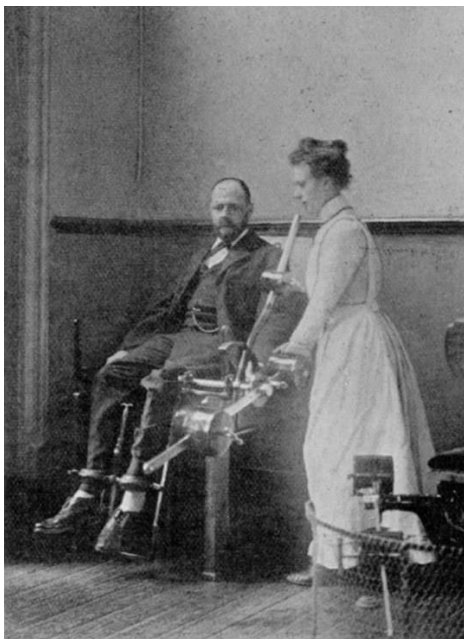
Heilgymnastiek anno 1900

Graag nemen we u eens mee hoe 100 jaar geleden, in dit geval in Utrecht, een consultatie- bureau voor mensen met 'lichamelijke beperkingen, deformiteiten, houdingsafwijkingen' etc. in zijn werk ging. Hoe werd er geschreven (of gedacht) over dergelijke aandoeningen en hoe organiseerde men dat? Wat waren de drijfveren en de sociaaleconomische overwegingen? Zijn er nog ervaringsverhalen?