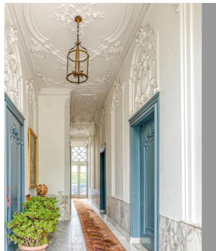
Links en rechts het huidige pand anno 2022 en voormalig Zanderinstituut te Utrecht waar ook kamerconcerten worden gegeven.