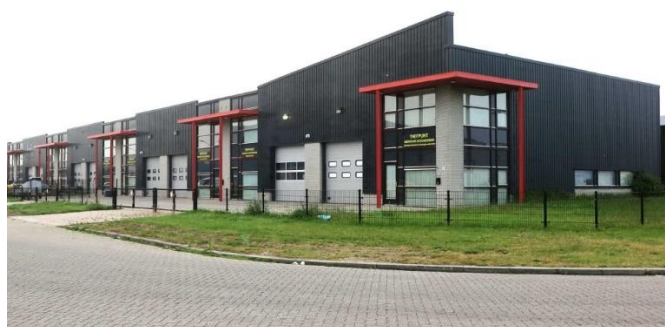
Locatie SGF en TMGN te Urk