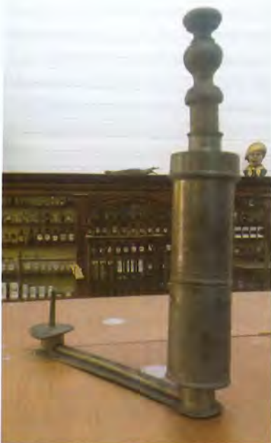
Het eerste klyisma

Kortom, het gesprek ging over de inbedding van de geschiedenis in