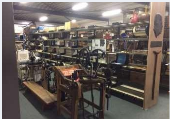
Apparatencollectie op Urk