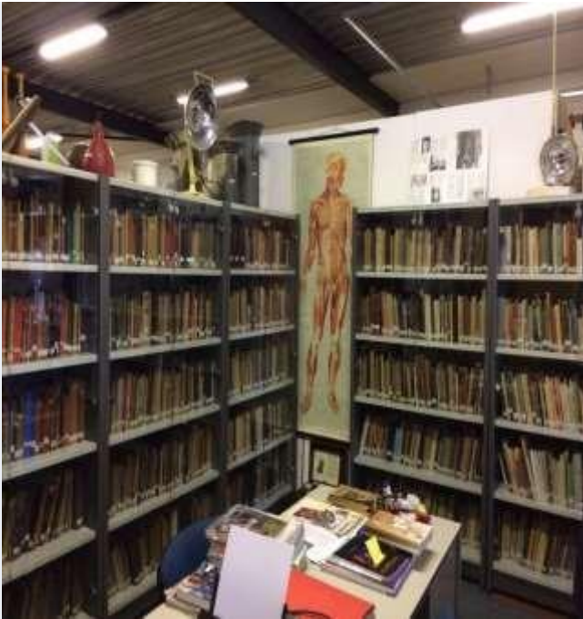
Boekencollectie SGF op Urk