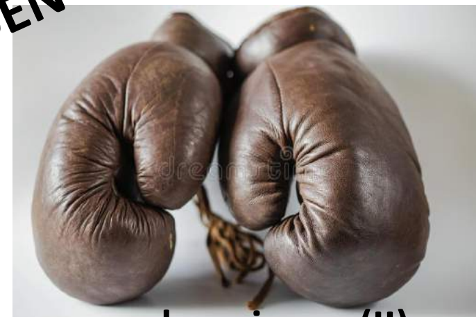
... erkenning ... (II)

‘Huiskamergesprek’: vervolgonderzoeken en -lezingen geschiedenis opleidingen en opleidingsverhalen? (VI)