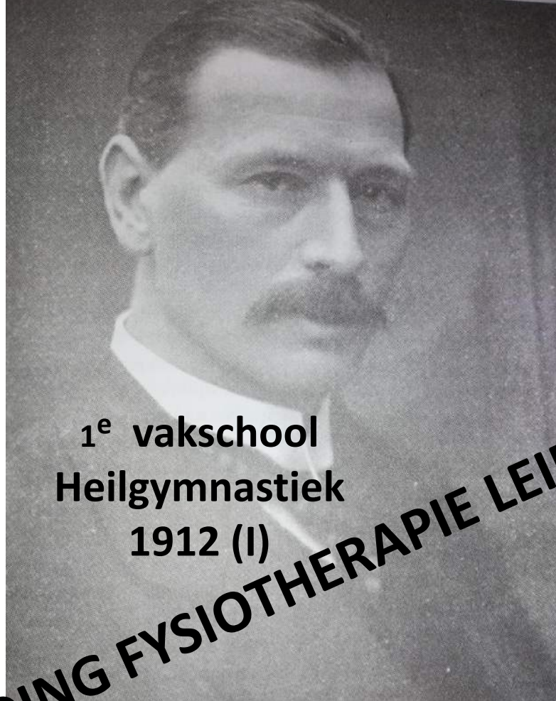
1 e vakschool Heilgymnastiek 1912 (I)